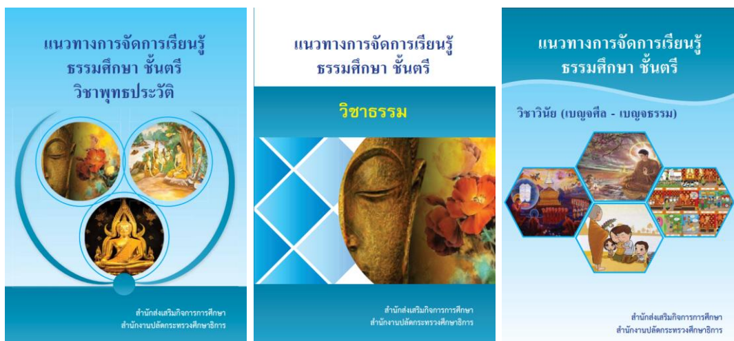
ภาพตัวอย่าง ปกหนังสือคู่มือสอนธรรมศึกษาชั้นตรี

ถ้าไม่มีครูพระ/ครูที่สามารถสอนวิชาธรรมศึกษาได้ ให้ประสานกับสำนักงานพระพุทธศาสนาจังหวัดหรือคณะสงฆ์ เพื่อขอให้ดำเนินการส่งพระสอนธรรมศึกษาในสถานศึกษา